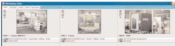
Werkstatt Ansicht: Sie erlaubt Ihnen einen sofortigen Überblick in Echtzeit, welche Ressourcen beschäftigt sind und welche still stehen.

Zu Anfang wird ein Unternehmen vielleicht nur die Funktionen zur Angebotserstellung, Auftragsverfolgung und Analyse verwenden. Wenn das Unternehmen wächst, sollen vielleicht Elemente, wie Barcode-Leser oder Touch-Screens zur automatischen Eingabe und Verfolgung von Zeitdaten hinzugefügt werden. Danach tritt womöglich irgendwann der Bedarf auf, auch Module zur Lagerverwaltung, zur Qualitätssicherung oder für die Cash-Flow Prognose hinzuzufügen.